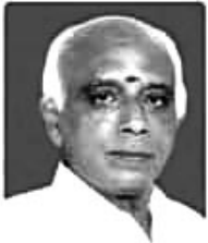
நிறுவனர் கோவை நாயகன் கலாச்சார சபா