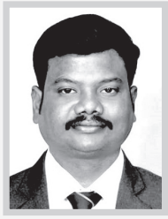
K.தாந்தோணி மாநில இளைஞர் அணி தலைவர் அயன்டரம் மண்டல செயலாளர்